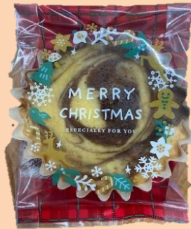
⑤ミックスマドレーヌ 150円