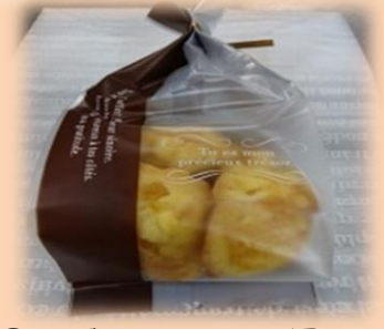
⑥ゆずマドレーヌ(5個入) 250円