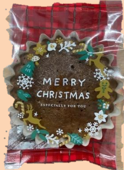
④ココアマドレーヌ 150円