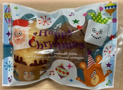
⑦どんぐりマドレーヌ 150円