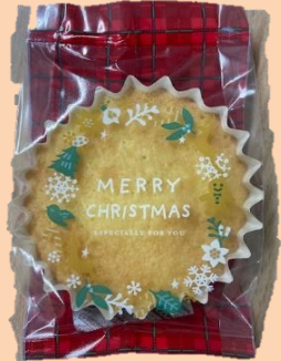
③フレンマドレーヌ 150円